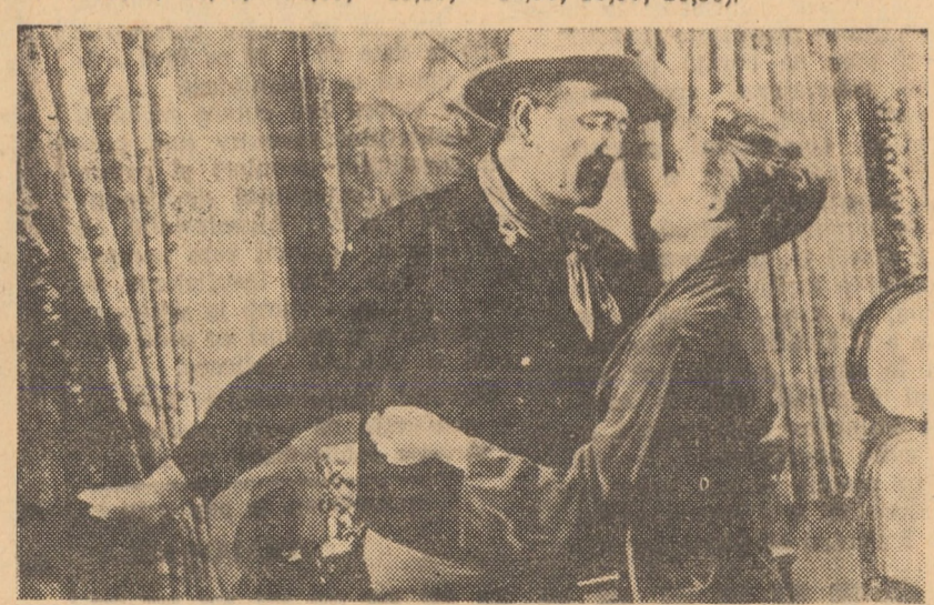
Actorii John Wayne și Angie Dickinson în filmul RIO BRAVO.

SIBIU: PACEA: Pașa (orele 9,00; 11,30; 14,30; 16,30; 19,00)