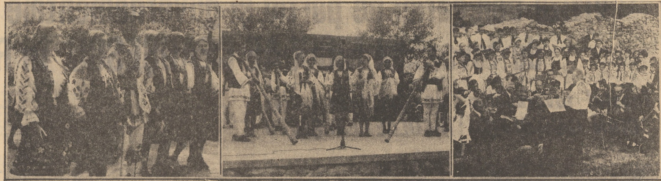
Secvențe din filmul plin de culoare al „Ciresarului '71”