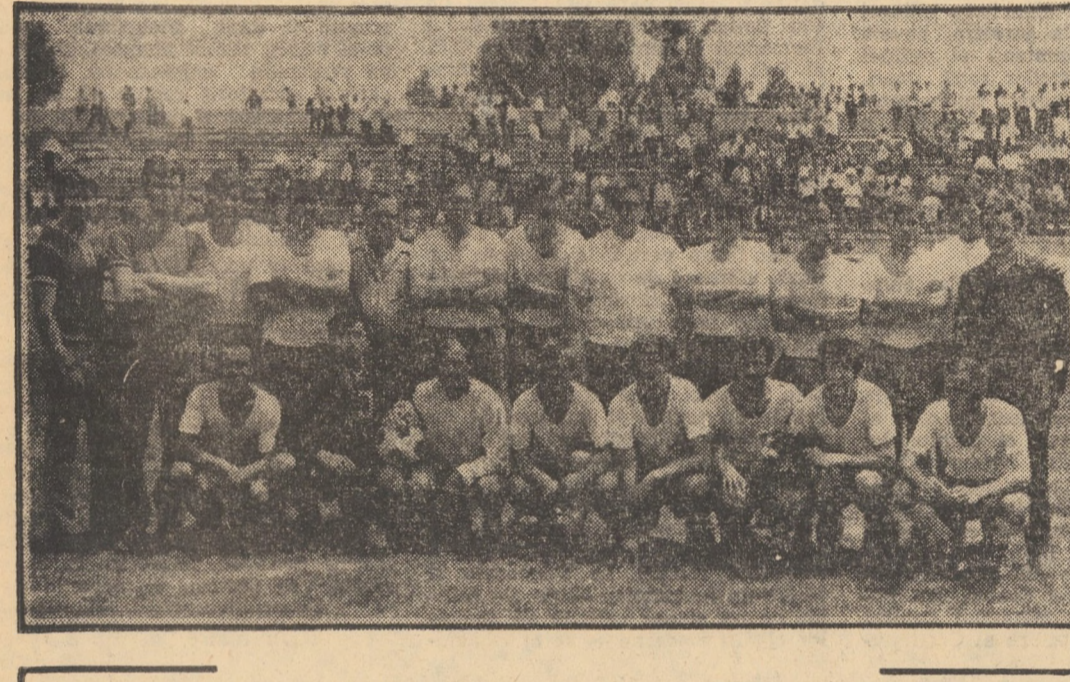
Dupa calificarea echipei de handbal in prima divizie... LE DORIM SUCCESI!