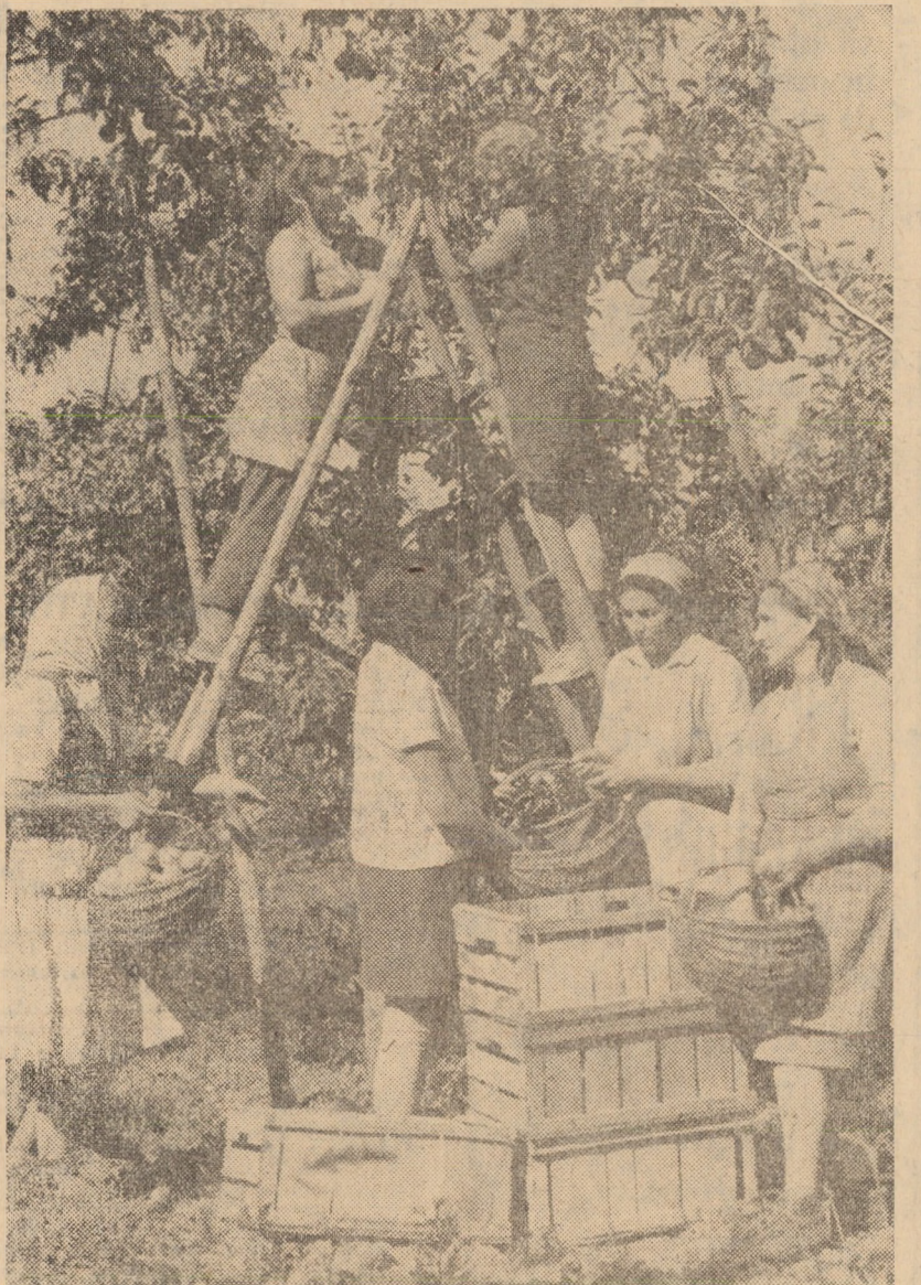
La ferma pomicolă a I.A.S. Bazna recoltatul merelor e în toi. Pentru calitatea fructelor obținute au de an, pomicultorii din Bazna sînt binecunoscuți și apreciați în întreaga țară și în străinătate. Astfel, o bună parte a producției este destinată exportului. Anul trecut, din recolta bogată a acestor livezi s-a realizat un beneficiu de 1.638.000 lei. În fotografie: aspect din timpul recoltării.

Pe lângă activitățile agricole, în hotarul „Hoveș” erau prezentă aproape întreaga „artilărie grea” a C.A.P.-ului. Intr-adevăr, un grup de șase tractoare arau de zor. Alături de acestea se găseau și două mașini de mecanizare, care erau în curs de reparare.