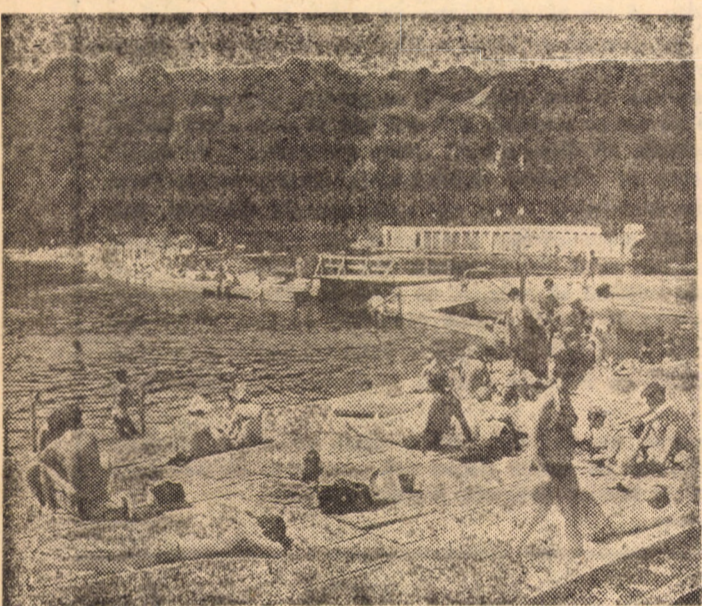
Zi de caniculă la ștrandul stațiunii din Ocna Sibiu

★ Trei hoți au comis recent la Copenhaga , cel mai mare furt din istoria Danemarcei