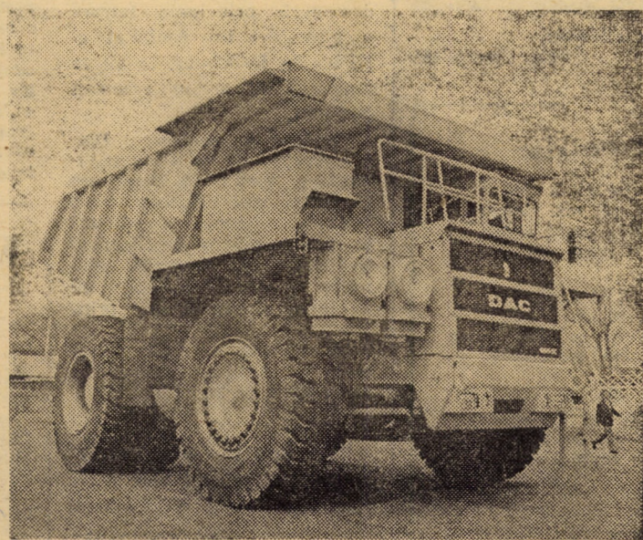
Unul dintre mesagerii iscusinței constructorilor de mașini de pe meleagurile sibiene: Autobasculanta 120 E (diesel-electrică)

Așadar, nu ne mai rămîne decît să urăm harnicilor constructori de mașini sibieni noi succese și cit mai multe premiere tehnice naționale și chiar mondiale.