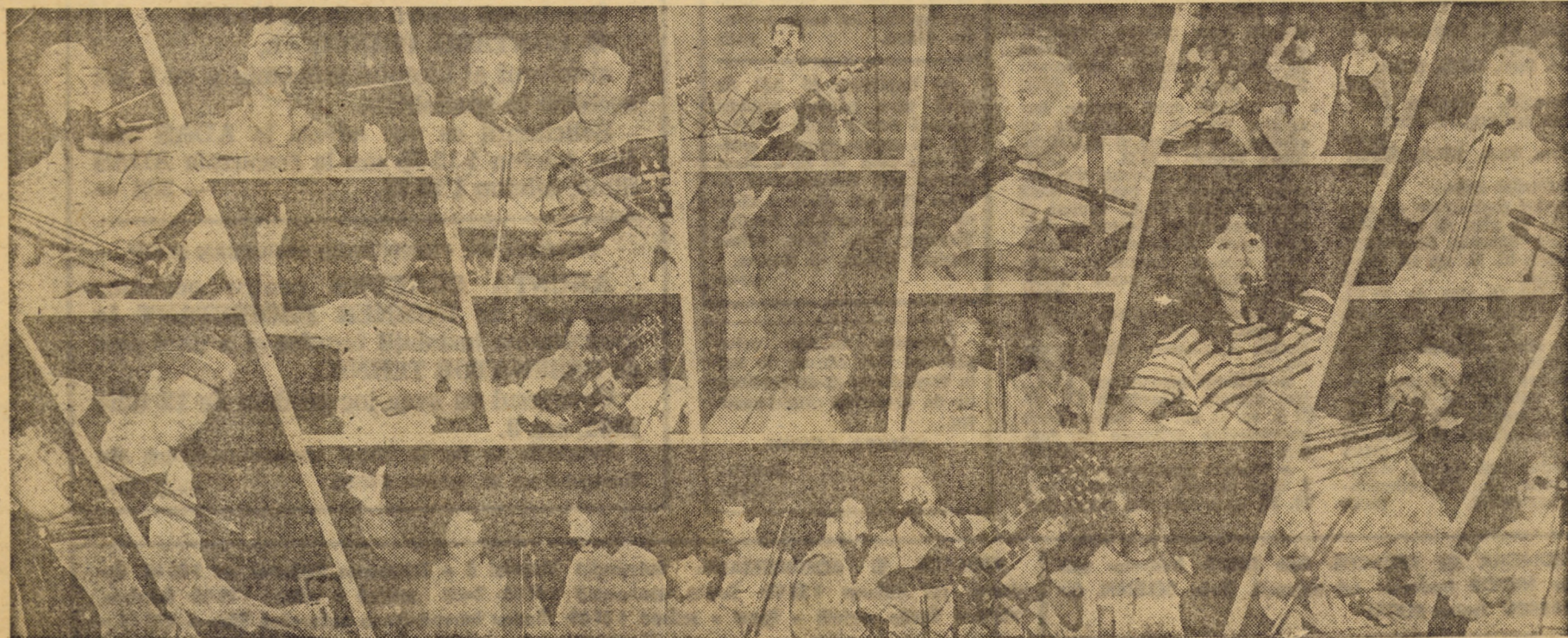
Secvențe de la spectacolul de muzică și poezie al Cnaclului „Flacăra” — la Sibiu

tul. Pămîntul a pierdut structura. Plantele nu au hrană și nu cresc. Pentru ca producțiile să fie la potențialul pămîntului suprafața foilor trebuie să fie mai mare de 4 ori ca suprafața terenului cultivat. Altfel nu facem producții. Vom ține mai mult cont de păreriile oamenilor, de propunerile lor. Fărănu-l iubesc pămîntul și animalele. Pămîntul e cel mai de preț bun pe care l-am moștenit de la strămoși. Datoria noastră e să-l înobilăm, să-l lăsăm urmașilor sănătos întru bucuria lor și urmașilor urmașilor lor.