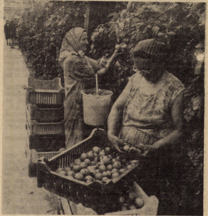
Recolta tomatelor, cultivate pe cele două hectare ale Fermei nr. 1 de la Întreprinderea de sere Dumbrăveni se arată bogată. Pînă în prezent au fost livrate beneficiarilor externi, cit și magazinelor de desfacere, o cantitate însumind 95 tone.

O analiză atentă a modului în care s-a desfășurat activitatea de control al oamenilor muncii în municipiul Mediaș scoate în evidență importanța lui deosebită în viața economico-socială ca formă obștească și democratică de participare a oamenilor muncii la conducerea treburilor obștești. Cele 139 de echipe investite cu autoritatea de control au cuprins în aria lor de activitate marea majoritate a domeniilor precizate de lege: unități de stat și cooperatiste care execută lucrări și prestări de servicii către populație, unități comerciale și de alimentație publică, depozite, institutii culturale-artistice, sanitare, creșe, grădinițe, căminare pentru tineret etc. Eficienta controlului efectuat, așa după cum s-a subliniat la consfătuire, este reflectată și de cele 890 controale efectuate, prilej cu care echipele de control au făcut 704 propuneri de