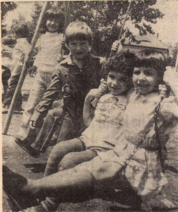
Copiii de la Grădinița nr. 40 din Sibiu își petrec o bună parte din timp în grădina special amenajată pentru ei