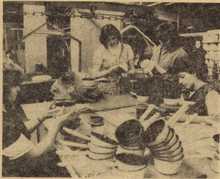
Operații de finisaj în cadrul fluxului tehnologic la „Emailul roșu”, Medias