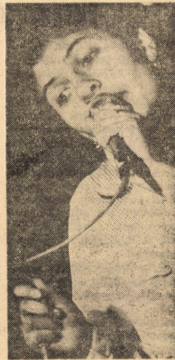
Imagini sugestive din prima seară a festivalului