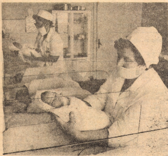
În cadrul spitalului din Cisnădie, secția de obstetrică și ginecologie dispune, prin grija partidului și statului, de cele mai bune condiții pentru realizarea unei asistente medicale superioare