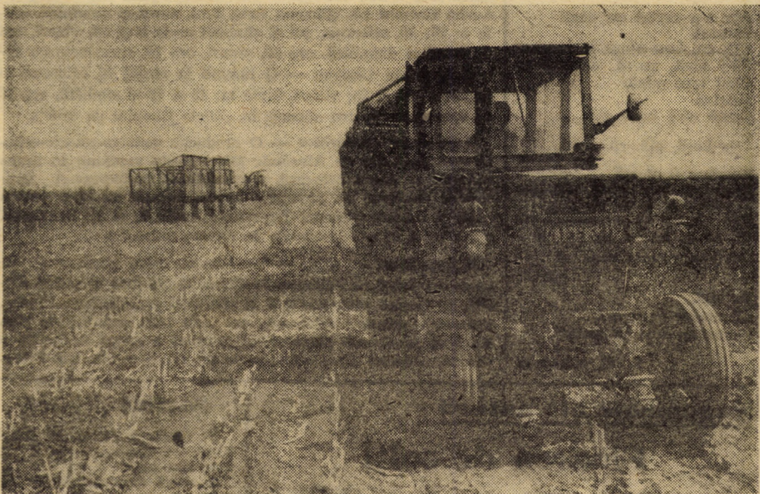
La fermele 4 și 5 ale I.A.S. Șura Mică se recoltează ultimele suprafețe de porumb siloz