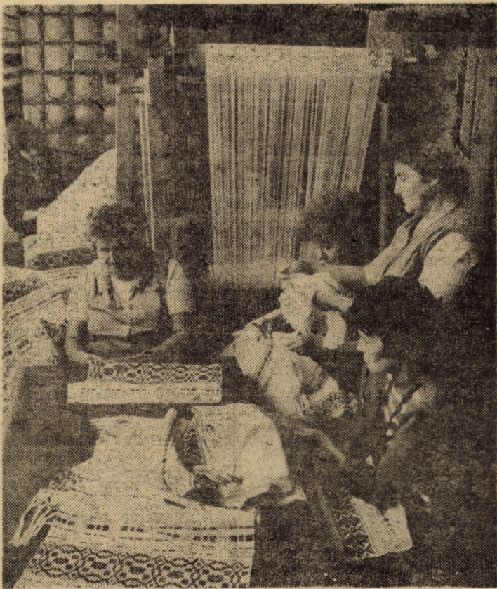
Apresiasi pentru varietatea și calitatea produselor artizanale pe care le realizează, harnicul colectiv al secției țesut manual din str. T. Laurean din localitate se numără printre fruntașii cooperativei „Arta Sibiului”