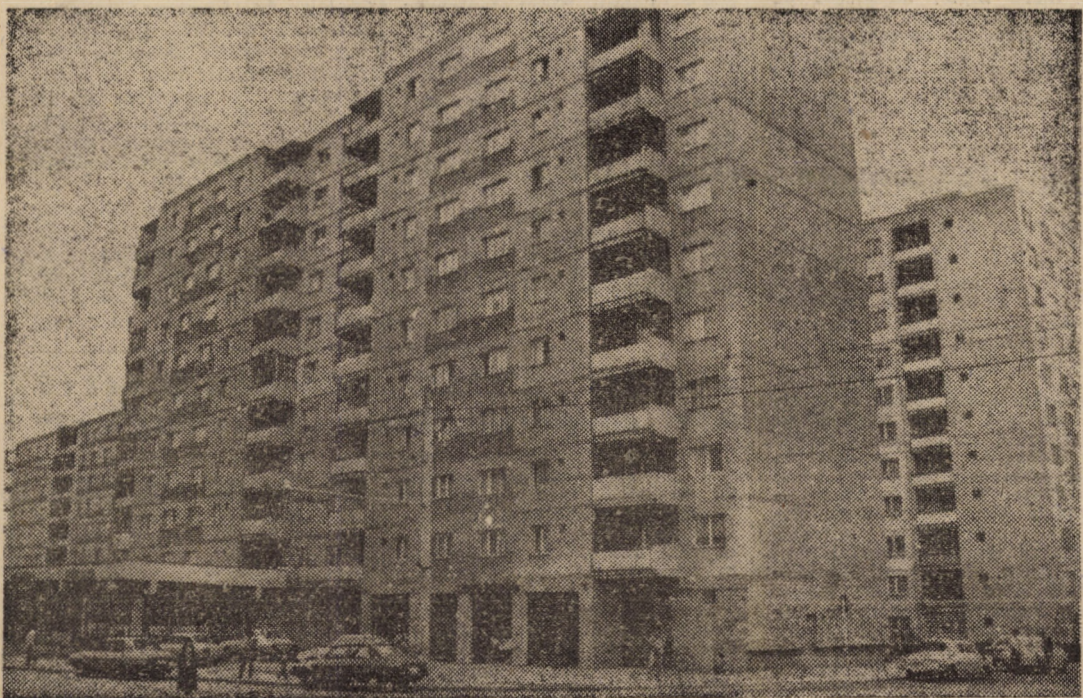
Impunătoare blocuri de locuințe cu 10 etaje și parter comercial din cartierul sibian „Vasile Aaron”