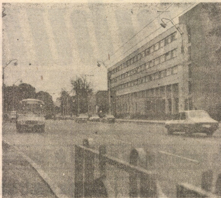
Pe noul bulevard 23 August din Sibiu, recent modernizat