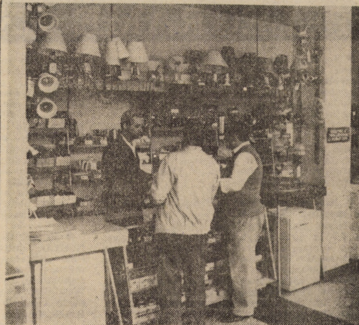
Raionul cu articole electrice al magazinului universal „Victoria” din Cisnădie. Buna aprovizionare și deservirea exemplară atrag zilnic mulți cumpărători