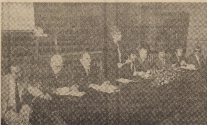
De un larg interes din partea participanților, sosiți din multe localități ale țării, s-a bucurat Simpozionul „Medicina complementară”, o prestigioasă manifestare științifică, găzduită sîmbătă, 9 septembrie a.c., de comuna Biertan, de unde vă redăm două imagini din timpul desfășurării lucrărilor

„Toate acestea — sublinia cu același prilej tovarășul Nicolae Ceaușescu — demonstrează cu putere cît de importantă au fost hotărîrile Congresului al IX-lea, de realizare a socialismului cores-