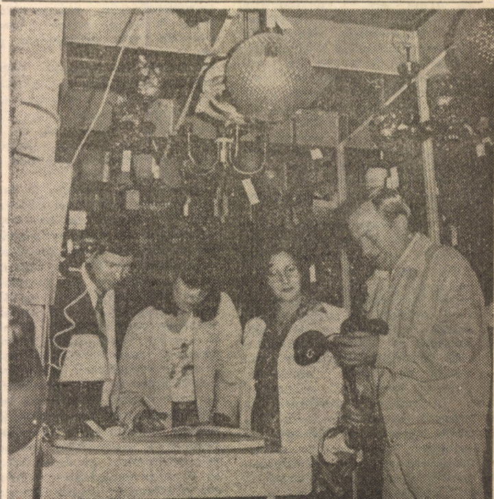
O echipă de control al oamenilor muncii în acțiune la raionul cu articole electrice al Magazinului universal „Dumbrava” din Sibiu

REPUBLICA SOCIALISTĂ ROMÂNIA. Colonel, Victor NEGHINĂ