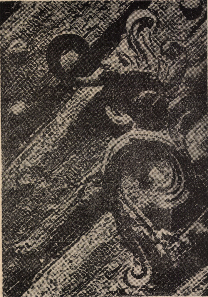
Ornament de orfevrerie la broasca unei porți seculare din Sibiu