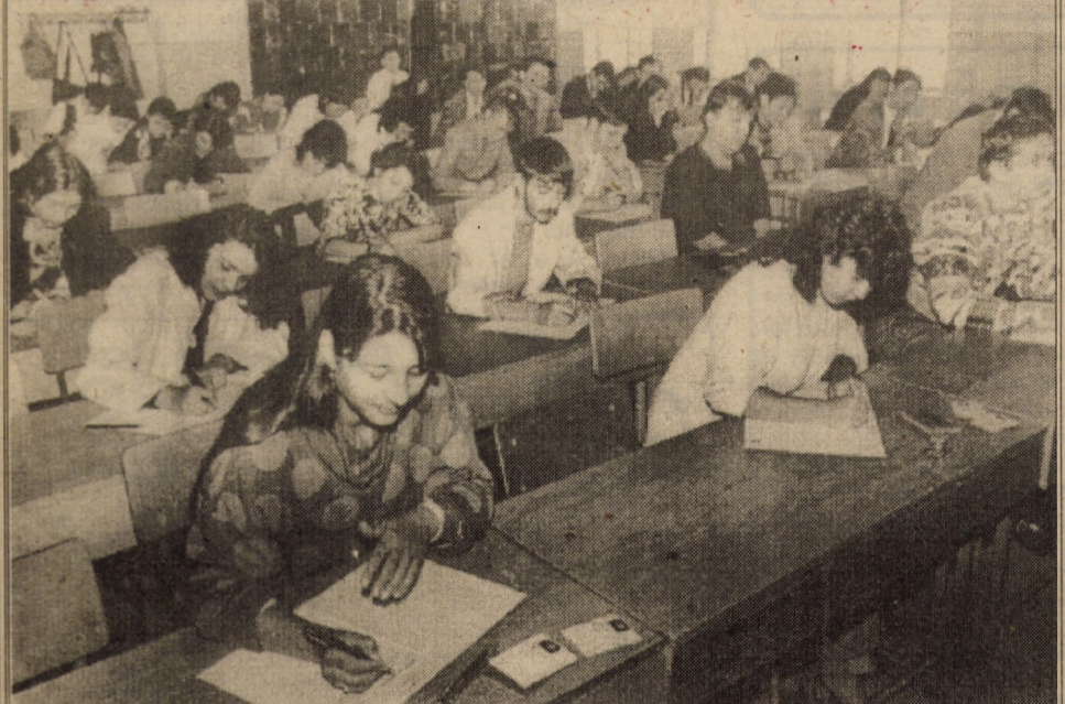
Tineretea înseamnă speranță și voința afirmării. O nouă generație se confruntă cu ea însăși. Au început admiterile!

au fost mult mai scurte". - Au vreo bază legală a acestor cereri? "Legea învățământului spune că examenul se ține în limba română. Pentru că ea a apărut târziu, anul trecut s-a admis examenul în limba maternă și s-a admis și acum considerându-se că cei care au studiat materiile de examen în limba maternă n-au avut timp să se pregătească în limba română". Ion SORESCU