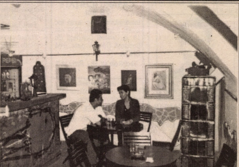
Text și foto: Fred NUSS