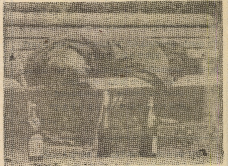
Sculați voi oropsiți ai vieții...

Filiala Județului Sibiu, cu sediul în Mediaș, (Primăria municipiului, camera 7, etaj 2), are următorul program de lucru: luni, orele 11—14 și miercuri, orele 10—14.